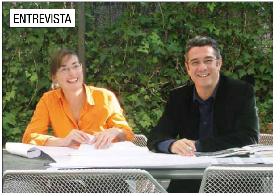
Foto: Mercedes Berengué y Miguel Roldán (Roldán & Berengué Arquitectos)